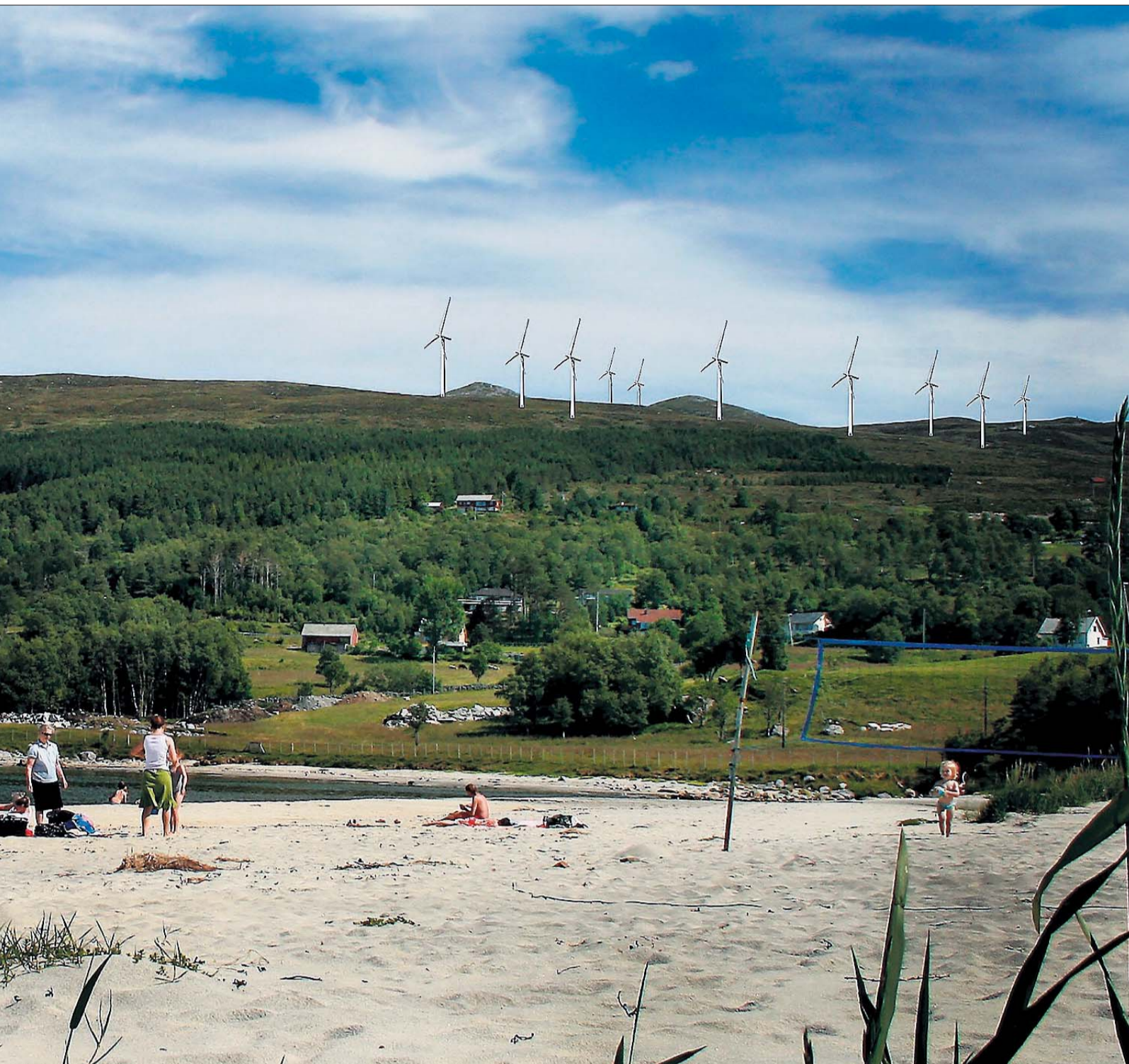
FRAMTIDA. Manipulert bilete som syner Sandviksanden, der det er planlagt hotell i enden, og vindturbinåsane i bakgrunnen. I dalen opp til høgre er det store hyttefelt.